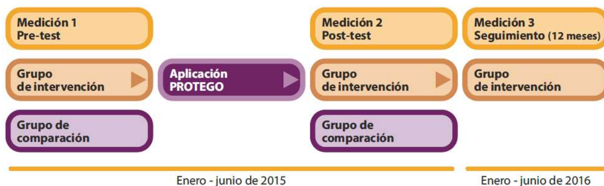
Figura 1: Diseño de la evaluación y del seguimiento a los 12 meses

Las mediciones pre-test, la aplicación del programa y las mediciones post-test se llevaron a cabo entre los meses de enero y junio de 2015. El seguimiento de la evaluación a los doce meses de finalizar la aplicación del programa se realizó entre enero y junio de 2016, sólo con el GI. El GC no participó en el seguimiento porque muchos de estos sujetos recibieron el programa entre el pos-test y el seguimiento, por lo que dejaron de ser controles.